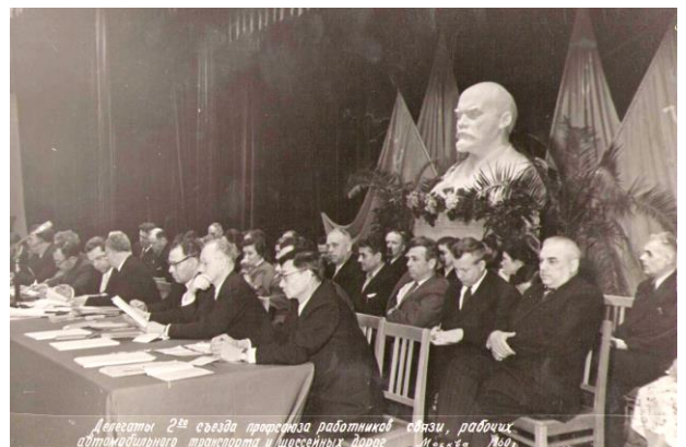
Делегаты 2-го съезда профсоюза работников связи, рабочих автомобильного транспорта и шоссейных дорог Москва, 1920 г.

Одним из основных направлений работы в тот период была борьба с неграмотностью. IV съезд профсоюза, обсудив этот вопрос, призвал все организации «придать работе по ликвидации неграмотности ударный характер», считать эту